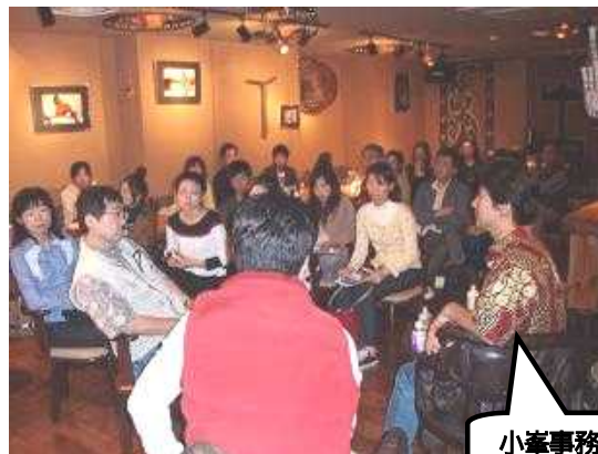
来場者とのトークセッション