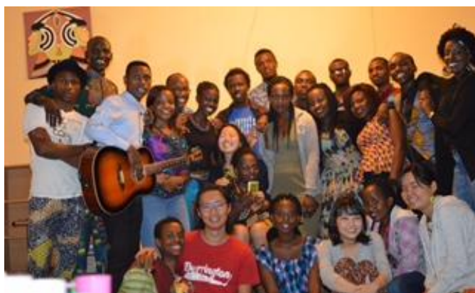
別の日本人留学生のお別れ会で

のように和解が進められているか、実際に自分の目で見てきます。その活動についてはまた後日報告させていただければと思っています。